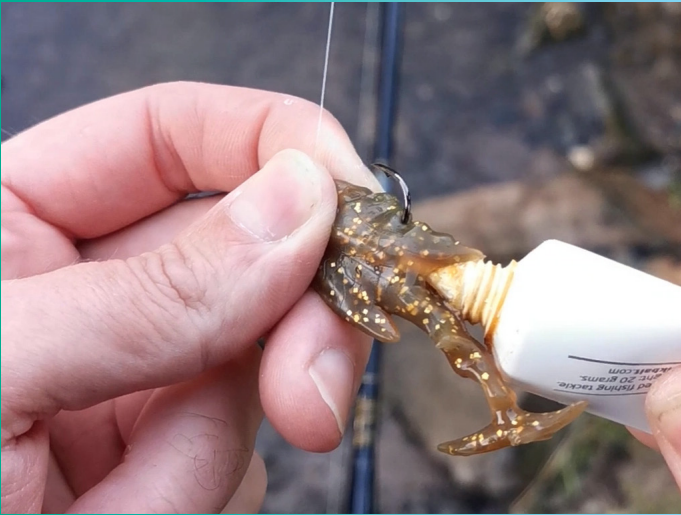
Für zusätzliche Reize den Hinterkopf mit Paste oder Rassel präparieren.