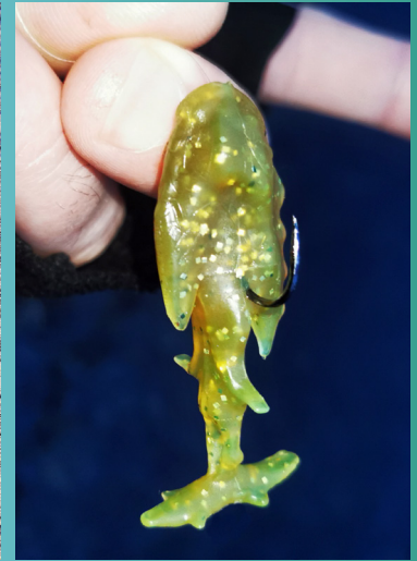
Oder mit dem Einzelhaken an diverse Rig-Montagen.