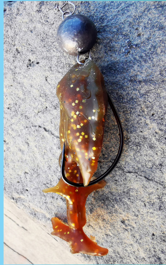
Montiert an einem Offset-Haken kombiniert mit Cheburashka Rig.